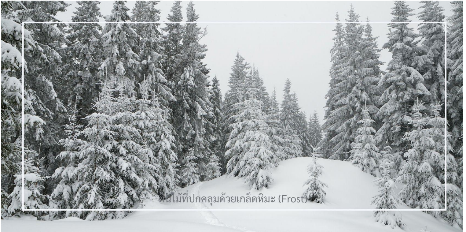
ต้นไม้ที่ปกคลุมด้วยเกล็ดหิมะ (Frost)

ยาบูลี (Yabuli) เมืองตากอากาศชื่อดังทางตอนเหนือของจีน ตลอดเส้นทาง ท่านจะได้เพลิดเพลินกับทัศนียภาพของ ฤดูหนาวที่งดงาม ราวกับฉากในนิยาย ท่ามกลางต้นไม้ที่ปกคลุมด้วยเกล็ดหิมะ (Frost) ระยิบระยับราวคริสตัล สอง ข้างทางแต่งแต้มไปด้วยหิมะขาวนวล สะท้อนแสงแดดยามเช้าอย่างอ่อนโยน เป็นบรรยากาศที่ทำให้ยากและงดงามจับ ใจในแบบเฉพาะของดินแดนภาคตะวันออกเฉียงเหนือของจีน