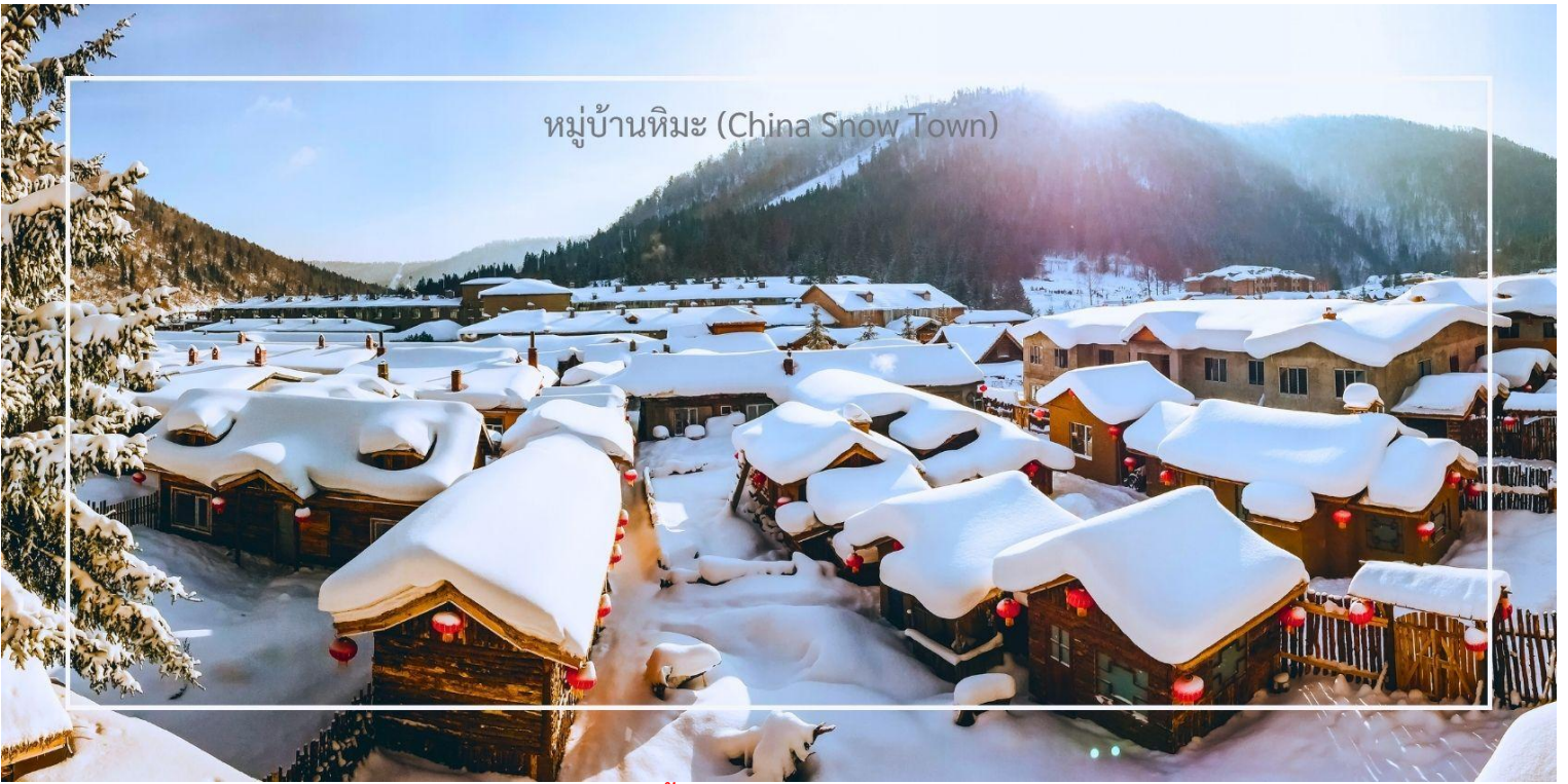
หมู่บ้านหิมะ (China Snow Town)