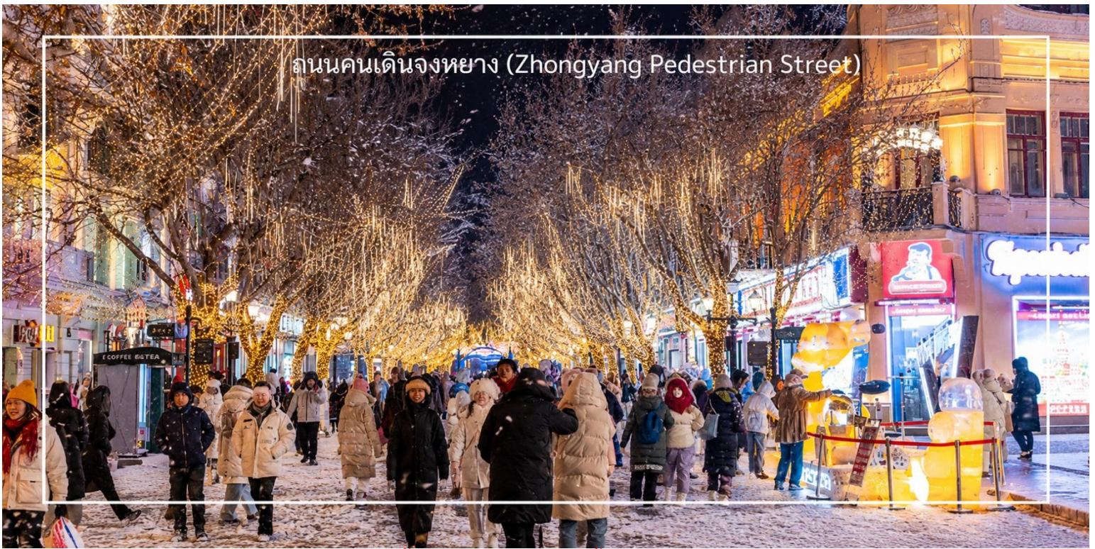
ถนนคนเดินจงหยาง (Zhongyang Pedestrian Street)

ค่า บริการอาหารค่ำ ณ ภัตตาคาร (เมื่อที่ 15) เมนูพิเศษ : สุกี้หม้อไฟ ได้เวลาสมควรนำท่านเดินทางสู่สนามบินเมืองฮาร์บิน (ไม่มีห้องพักสำหรับ 3 ท่าน กรณีเดินทาง 3 ท่านต้องจ่ายค่าพักเดี่ยวเพิ่ม)