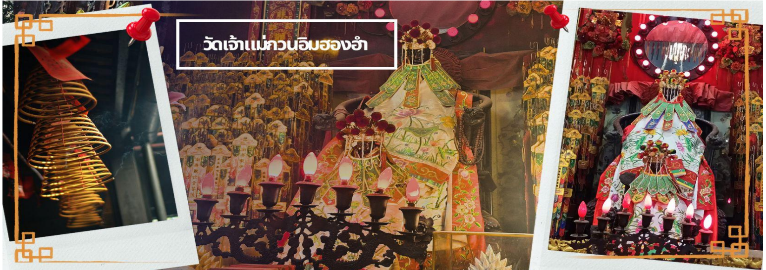
วัดเจ้าแม่กวนอิมของอ้า

ท่านชม โรงงานจิวเวอรี ซึ่งเป็นโรงงานที่มีชื่อเสียงที่สุดของฮ่องกงในเรื่องการออกแบบเครื่องประดับ อาทิเช่น จี้ และแหวนกำหนั ที่สวยงามโดดเด่นไม่มีใครเหมือนใคร ซึ่งถือกำเนิดขึ้นที่นี่และมีชื่อเสียงที่สุดใช้เป็นเครื่องประดับติดตัว และเสริมดวงชะตา สินค้าทุกชิ้นมีเอกสารรับประกันคุณภาพเปลี่ยน ซ่อม ด้ตลอดอายุการใช้งาน หากเกิดการชำรุดจากสินค้าไม่ใช่อุบัติเหตุ และนำท่านเลือกซื้อ เครื่องประดับที่ ร้านปีเซี่ยะ ซึ่งคนจีนนั้นถือว่าปีเซี่ยะ หรือเผ่เย้า ที่ทำจากหยกที่เป็นตัวแทนของความสวยงามและความบริสุทธิ์ มีความเชื่อว่าหยกมีพลังมงคล เสริมอายุยืนและสุขภาพดี และปีเซี่ยะในตำนานลูกหลานมังกร ช่วยหาเงินหาทอง กินไม่รู้จกัอม เชื่อว่าเป็นสัตว์นำโชค สู้คริวเรื่อน