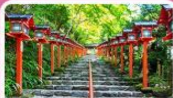
ศาลเจ้าคิฟูเนะ