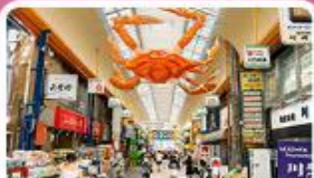
ตลาดคุโรเม

03 - 07 ก.ค. 69 | 19 - 23 ส.ค. 69 | 25 - 29 ก.ย. 69