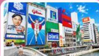
ชินไซบาชิ