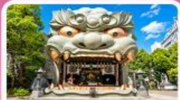
ศาลเจ้านิมมะ ยาชากะ