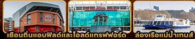
เยือนถิ่นแอนฟิลด์และโอลด์แทรฟฟอร์ด ล่องเรือแม่น้ำเทมส์