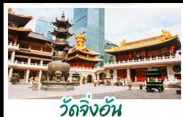
วัดจิ้งอัน