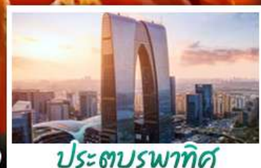
ประตูบูรพาทิศ