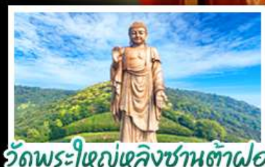
วัดพระใหญ่เขลิงซานต้าฝอ