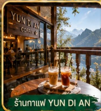
ร้านกาแฟ YUN DI AN