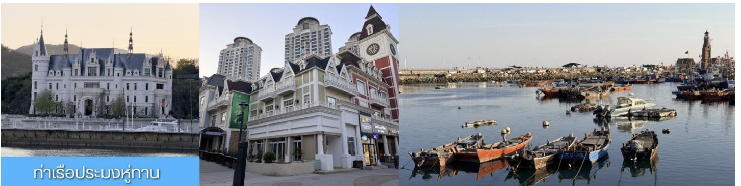
ท่าเรือประมงหู่กาน

พักที่ DALIAN JUZISHUIJING HOTEL หรือ โรงแรมระดับ 4 ดาวท้องถิ่น เมืองต้าเหลียน