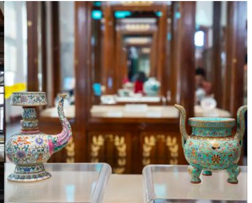
พิพิธภัณฑสถานประวัติศาสตร์ลี่ซุ่น

จากนั้นนำท่านเที่ยวชมและเก็บภาพ ณ พิพิธภัณฑสถานประวัติศาสตร์ลี่ซุ่น 旅顺博物馆 เป็นอาคารพิพิธภัณฑ เก่าแก่อายุกว่าร้อยปีแห่งแรกที่สร้างขึ้นทางภาคตะวันออกเฉียงเหนือของจีน อาคารพิพิธภัณฑมีความโดดเด่น ด้วยสถาปัตยกรรมแบบกรีก โรมันยุคเรเนสซองส์ ผสมผสานสถาปัตยกรรมแบบตะวันตก ภายในมีการจัดแสดง โบราณวัตถุกว่า 60,000 ชิ้น ท่านสามารถเก็บภาพที่ระลึกด้านหน้าอาคารพิพิธภัณฑ และสามารถเข้าชม โบราณวัตถุภายในพิพิธภัณฑได้ตามอัธยาศัย (พิพิธภัณฑปิดทุกวันจันทร์)..