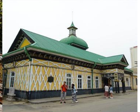
สถานีรถไฟลี่ซุ่น

นำท่านเที่ยวชมและเก็บภาพ ณ สถานีรถไฟลี่ซุ่น 旅顺火车站 เป็นสถานีปลายทางของเส้นทางรถไฟสาขา เส้นหยาง - ต้าเหลียน สร้างขึ้นในปีค.ศ. 1903 ออกแบบโดยสถาปนิกชาวรัสเซีย เป็นอาคารอิฐก่อปูนผสม โครงสร้างไม้ตามสถาปัตยกรรมรัสเซีย.