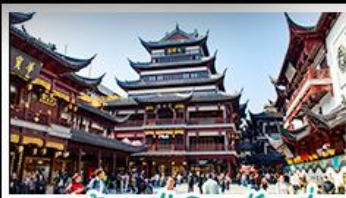
ตลาดร้อยปีฉงหวังเหมี่ยว