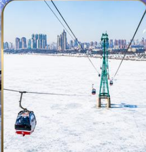
นั่งกระเช้าไฟฟ้า HARBIN ROPEWAY

❄️ รวมของแถมสุดพิเศษ ❄️ ถุงมือกันหนาว 1 คู่ ไอศกรีม 1 แท่ง หมวกกันหนาว 1 ชิ้น