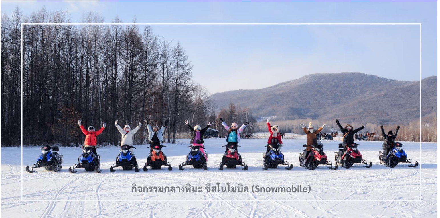
กิจกรรมกลางหิมะ ซึสโนโมบิล (Snowmobile)

สนุกสนานกับอีกหนึ่งกิจกรรมยอดนิยมของฤดูหนาว นั่นคือ การขับสโนว์โมบิล (Snowmobile ) สัมผัสความตื่นเต้นเร้าใจ กับการขับเคลื่อนผ่านหิมะอันกว้างใหญ่ ท่ามกลางบรรยากาศของภูเขาและป่าสนที่ปกคลุมด้วยหิมะขาวราวกับเทพนิยาย อีกหนึ่งกิจกรรมสุดมันส์ที่ไม่ควรพลาดในการผจญภัยท่ามกลางฤดูหนาวของเมืองหนาวสุดขีด (รวมค่ากิจกรรม ใช้เวลาประมาณ 20-30 นาที)