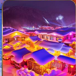
หมู่บ้าน DREAM HOME