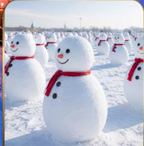
สวนตุ๊กตาหิมะ