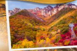
อุทยานแห่งชาติชอรัคซาน