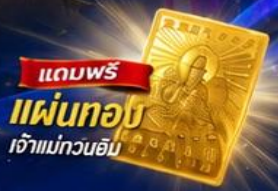
แถมฟรี แผ่นทอง เจ้าแม่กวนอิม