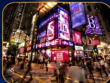
ซุปปิ้งชินชาฮ่วย