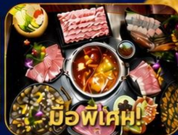
บุฟเฟ่ต์ชาบูสโด้ล่องกง