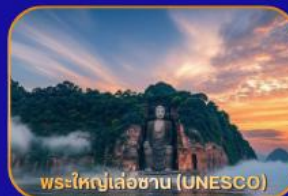
พระใหญ่เส่อซาน (UNESCO)