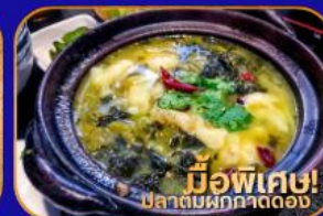
เมนูพิเศษ! ปลาต้มผักกาดดอง