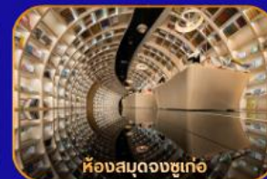
ห้องสมุดจงซูเก่อ