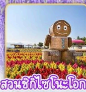
สวนซึทึชิโนะโอกะ