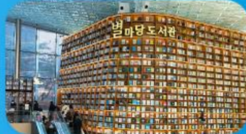
ห้องสมุดสตาร์ฟิว