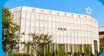
บรูกลินกาหลี