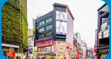
ช้อปปิ้งย่านเมียงดง