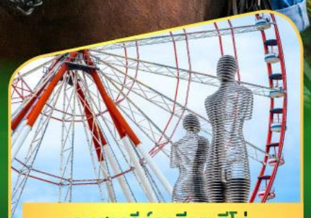
อนุสาวรีย์อาลีและนีโน่