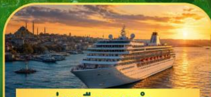
ล่องเรือทะเลดำ