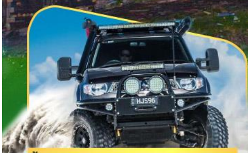
ขึ้นรถ 4WD สู้อีกกลางเทือกเขาคอเคซัส