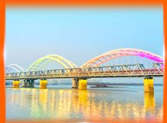
สะพานรถไฟปิ่นจิว