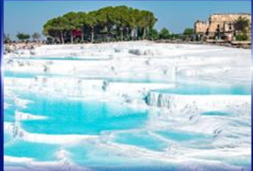
ปราสาทบุนยาดียา ปามุกคาเล