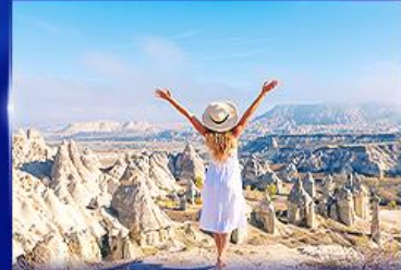
ชมความงดงาม หุบเขาแห่งรัก