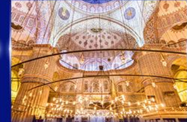
เข้าชมความงามสุเหร่าสำน้ำนิน