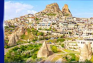
หุบเขาอูซซาร์ คัปปาโดเกีย