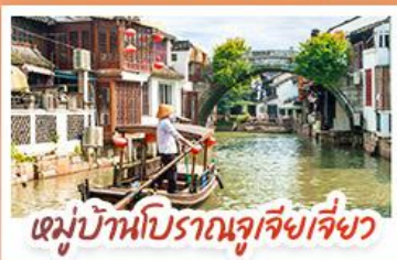
หมู่บ้านโบราณจูเจียงเจี๋ย

สวนสนุกเซี่ยงไฮ้ดิสนีย์แลนด์ เต็มวัน (รวมรถรับ-ส่ง)