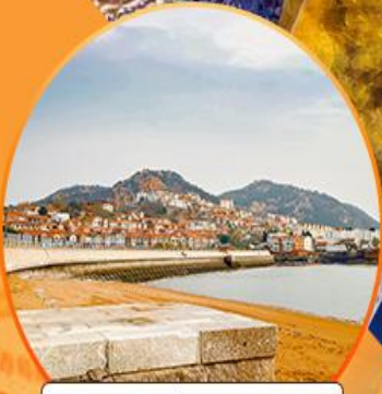
ซาจื่อโป่ว