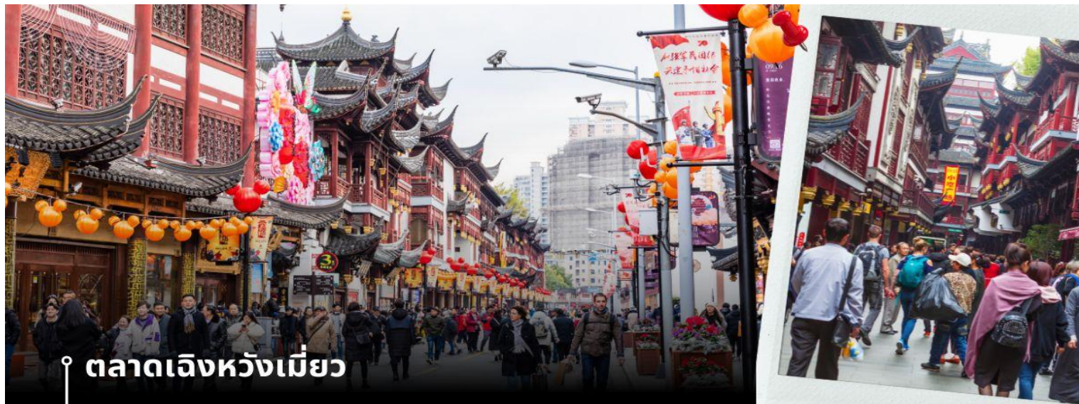
📍 ตลาดเจิ้งหวังเมี่ยว

จากนั้นนำท่านสู่ ตลาดเจิ้งหวังเมี่ยว เป็นศูนย์รวมสินค้า และอาหารพื้นเมืองที่แสดงถึงเอกลักษณ์ของชาวเซี่ยงไฮ้ซึ่งมีการผสมผสานระหว่างอดีตและปัจจุบันได้อย่างลงตัว ซึ่งเป็นย่านสินค้าราคาถูกที่มีชื่ออีกย่านหนึ่งของนครเซี่ยงไฮ้ ให้ท่านอิสระช้อปปิ้งตามอัธยาศัย