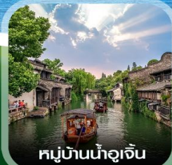
หมู่บ้านน้ำอูเจิน