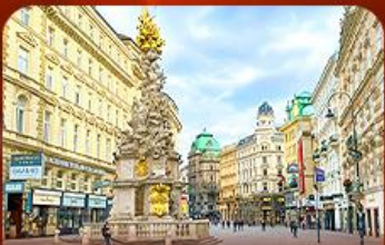
คาร์ทเนอร์ สตรีท ออสเตรีย