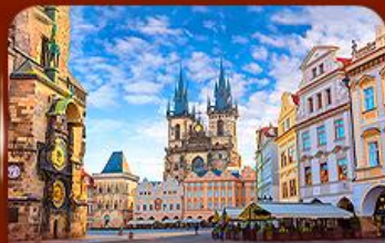
ชมย่านเมืองเก่า ปราก