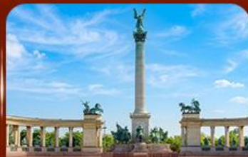
จัตุรัสวีรบุรุษ บูดาเปสต์