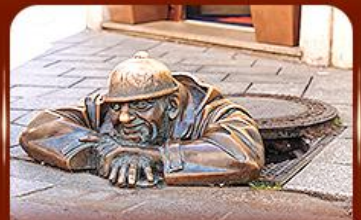
แลนด์มาร์คดัง รูปปั้นคูมิลา ปรากติสลาวา