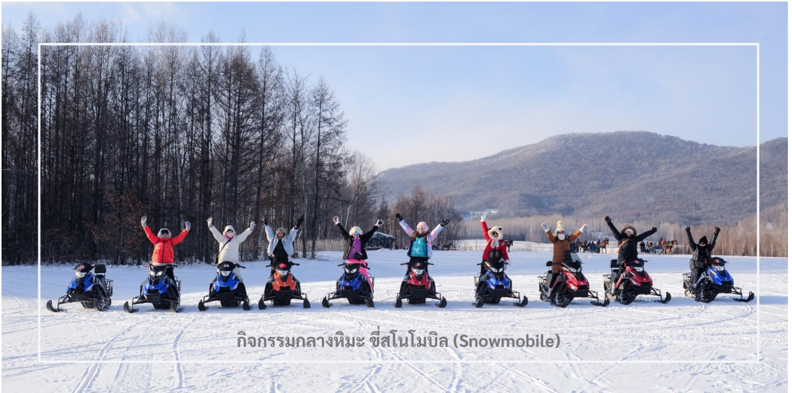
กิจกรรมกลางหิมะ ซีสนโมบิล (Snowmobile)

สมควรแก่เวลานำท่านเดินทางสู่เมือง มู่ตันเจียง (Mudanjiang) ใช้เวลาเดินทางประมาณ 2 ชั่วโมง มู่ตันเจียง เมืองสำคัญตั้งอยู่ใกล้พรมแดนรัสเซีย ห่างไปทางตะวันตกประมาณ 110 กิโลเมตร เมืองนี้มีเอกลักษณ์วัฒนธรรม และสถาปัตยกรรมที่ผสมผสานระหว่างรัสเซียและจีน โดยเฉพาะในฤดูหนาวเมืองจะถูกปกคลุมด้วยหิมะขาวโพลน