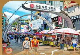
ตลาดนัมโพดง