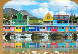
ท่าเรือจั้งเนม