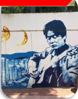
ถนนคิมควังชอก

นำท่านเที่ยวชม ถนนคิมควังชอก เป็นถนนสายเล็ก ๆ สดอบอุ่นในเมืองแทกู ที่สร้างขึ้นเพื่อระลึกถึง คิมควังชอก นักร้องโฟล์กในตำนานของเกาหลีใต้ ผู้เกิดที่แทกูและเป็นศิลปินที่คนเกาหลียังคงรักมากจนถึงทุกวันนี้ เดิมทีบริเวณนี้เป็นกำแพงเก่าใต้ทางรถไฟ แต่ภายหลังถูกพัฒนาให้กลายเป็น "ถนนแห่งเสียงเพลงและความทรงจำ" ตลอดทางจะเต็มไปด้วยภาพวาดกราฟฟิตี้ รูปปั้นของคิมควังชอก งานศิลปะและมุมถ่ายรูปแนววินเทจ เส้นห์ของถนนนี้ไม่ใช่ความอลังการ แต่เป็นความรู้สึก "อบอุ่นและมีเรื่องราว" คาเฟ่ ร้านดนตรี และบรรยากาศย้อนยุค