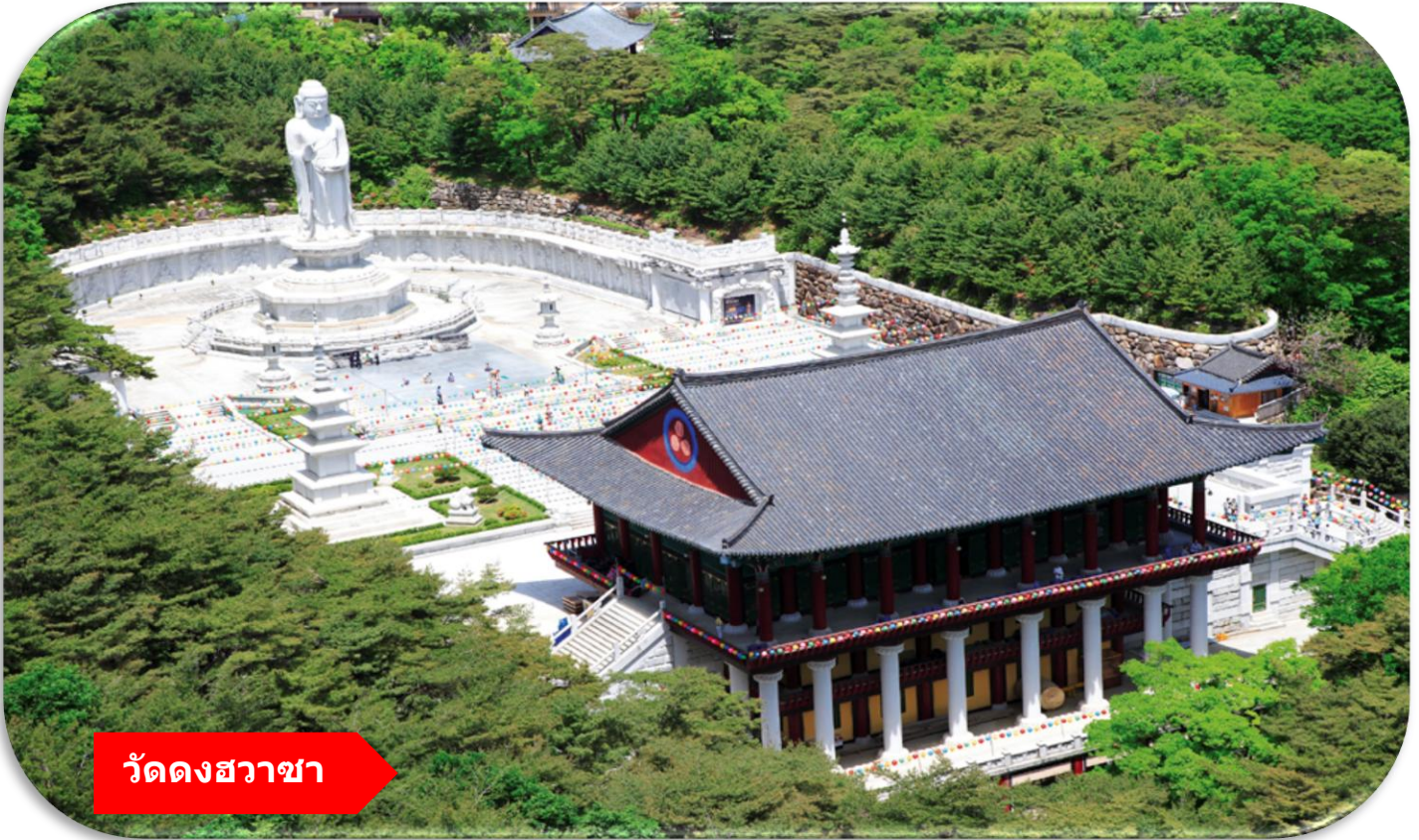
วัดดงฮวาซา