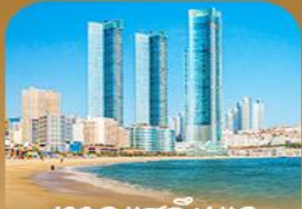
หาดแฮอินแด