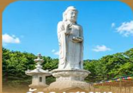
วัดดงฮาซา

เปิดประสบการณ์เที่ยวเกาหลีสุดคุ้ม บินครั้งเดียว เที่ยวสองเมือง • เช็กอินถนนมิตรภาพคิมควังซอก สัมผัสเสน่ห์ศิลปะและเสียงเพลง • นั่งรถไฟไปบุกเบิกชมวิวกทะเลปูซาน • หมู่บ้านคิมซอนสีสันสดใส ก่อนเยือนวัดแสดงงุงงูซาและวัดคงฮวาซา เสริมความเป็นสิริมงคล • แวะชมท่าเรือสีรุ้ง Bunezia ปิดท้ายด้วยชายหาดแฮอินแคแลนค์มาร์กชื่อดัง พร้อมเดินช้อปปิ้ง Walking Street สุดฟิน