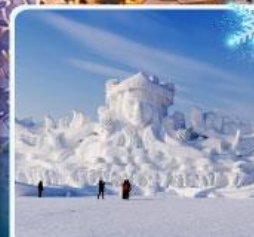
งานแกะสลัก เกาะพระอาทิตย์