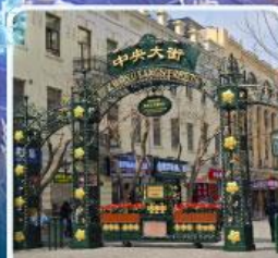
ถนนจงยาง