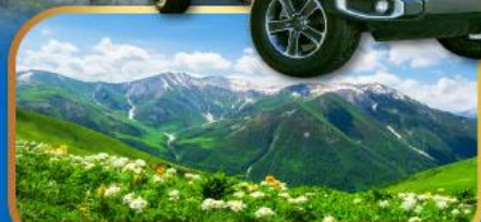
4WD สู่ใจกลางเทือกเขาคอเคซัส