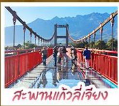
สะพานแกว่งลี้เจียง