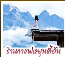
ร้านอาหารฟิชเชียนตี้ฮัน

ชมวิวภูเขาหิมะสวยสุดโรแมนติกกับแสงยามพลบค่ำ เที่ยวเมืองโบราณต้าหลี่ ลี้เจียง ไร่ชา แซงกรี่ล่า ชมวิถีชีวิตของชุมชนยูนนานและทิวทัศน์ สุดงดงามกล้าท้าเดินชมสะพานแกว่งลี้เจียง • ซุปปิ้งเพลินที่ถนนคนเดินหนานผิงเจียง