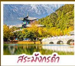
สระมั่งกรด้า