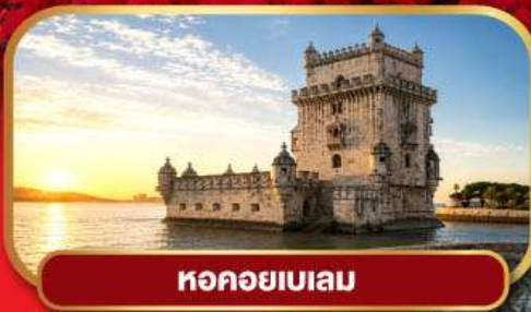
หอคอยเบเลม