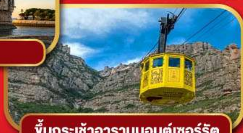
ขึ้นกระเช้าอารามมอนต์เซอร์ริต

Special Trips ขึ้นกระเช้าไฟฟ้า อารามมอนต์เซอร์ริต กับตำนาน Black Madonna