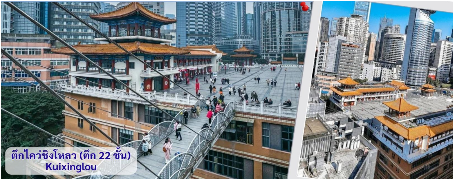
ตึกไควชิงโหลว (ตึก 22 ชั้น) Kuixinglou