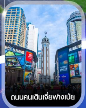
ถนนคนเดินเจียฟางเป็ย