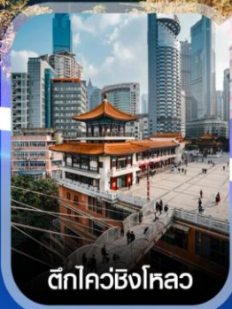
ตึกไคว่ซิงโหลว

✈️ คอนเฟิร์มออกเดินทาง ทุกพีเรียด 2 ท่านขึ้นไป