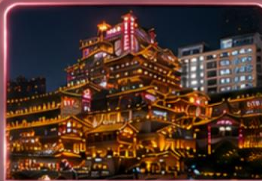
ชมแสงสีหงหยาดัง