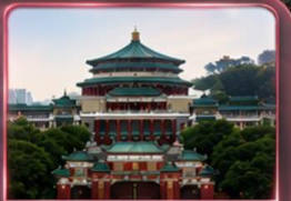
ศาลาประชาคม (ชมด้านนอก)