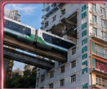
นั่งรถไฟทะลุติ๊ก 2 สถานี