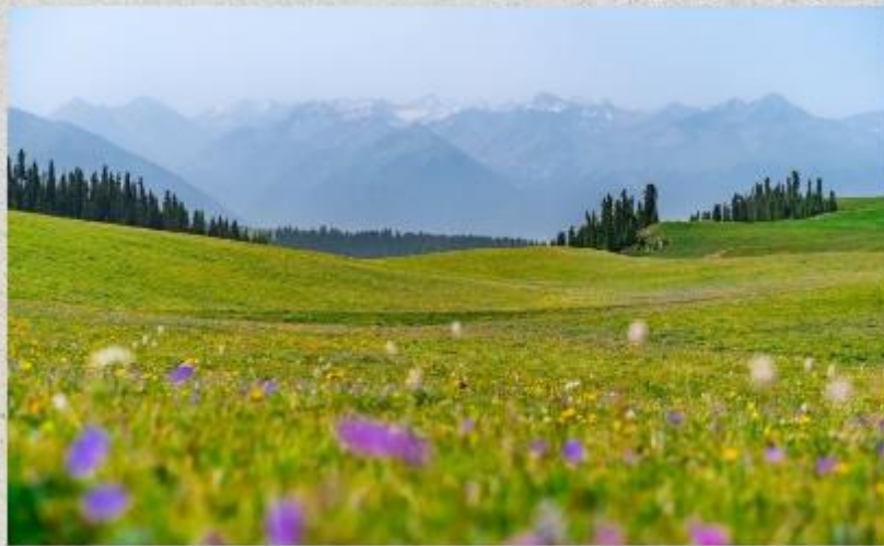
ทุ่งหญ้าคารา