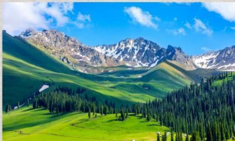
ทุ่งหญ้านาลาถี