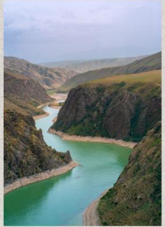
แกรนด์แคนยอนคุโคซู