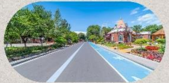
หมู่บ้านโบราณอุยกูร์คาจันฉี