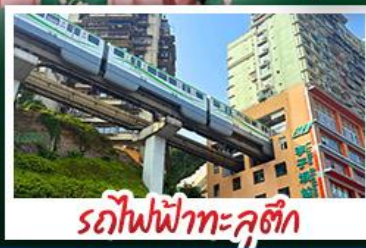
รถไฟฟ้าทะเลอู๋หลง