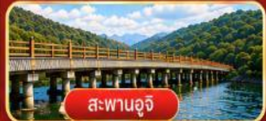
สะพานอูจิ