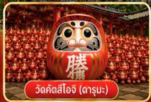
วัดคิตสึโองิ (ถารุมะ)