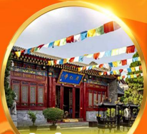
วัดกวางเหิน