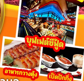
บุฟเฟต์ซีฟู้ด