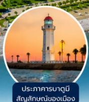
ประภาคารบาตุมิ สัญลักษณ์ของเมือง