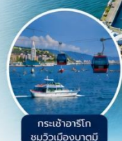
กระเช้าอาร์โก ชมวิวเมืองบาตุมิ