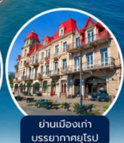
ย่านเมืองเก่าบรรยากาศยุโรป