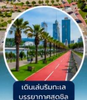
เดินเล่นริมทะเลบรรยากาศสุดชิล