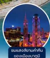
ชมแสงสียามค่ำคืนของเมืองบาตุมิ