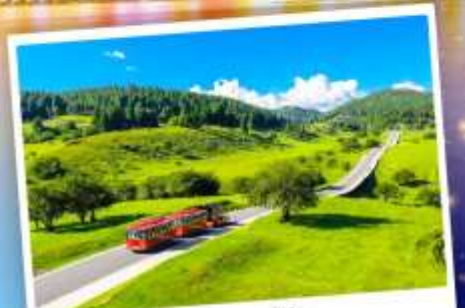
เจานางฟ้า