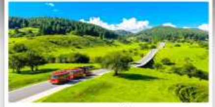
เหนางฟ้า

เดินทางโดย: สายการบินฉงชิ่งเจียงเป่ย์ (PN)