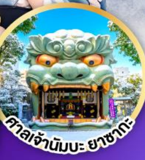
ศาลเจ้ามิบะ ยาชากะ