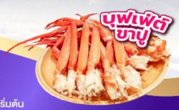
บุฟเฟ่ต์ ซาซุ

พักออนเซ็น 1 คืน เที่ยวชมงานประดับไฟ ซากามิโกะ อิลลูมินเชัน