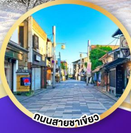
ถนนสายซาฟิยว