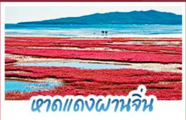
หาดแดงพานจีน