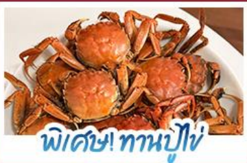
พิเศษ! ทานปูไข่

ปรากฏการณ์ธรรมชาติ 1 ปี มีแค่ครั้งเดียว! เตรียมชุดเก่งไปถ่ายรูปกับ 'หาดแดงพานจีน' ที่กำลังพรมสีแดงสดไปทั่วผืนน้ำ พร้อมฟินสุดขีดกับฤดูกาลทานปูไข่ที่ดีที่สุดแห่งปี • สัมผัสสวนสิลาแห่งตะวันออกที่ดำหลายน