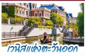
เวนิสแห่งตะวันออก