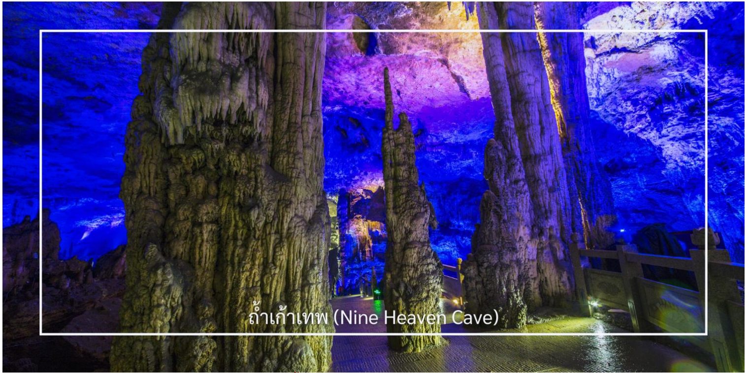
ถ้ำเก้าเทพ (Nine Heaven Cave)