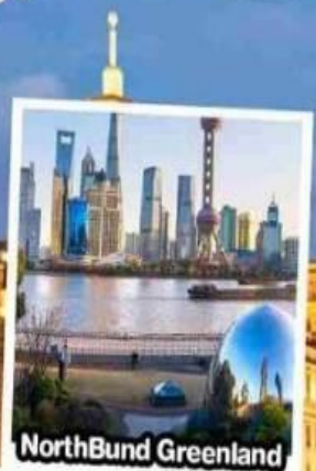
North Bund Greenland