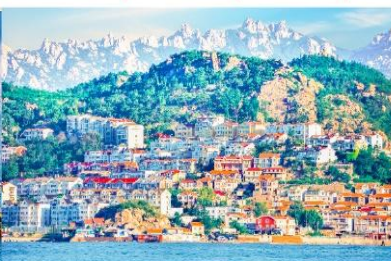
หมู่บ้านชาวประมงชาจื่อโซ่ว