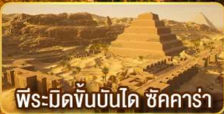
พีระมิดขั้นบันได ชิคคาร์่า