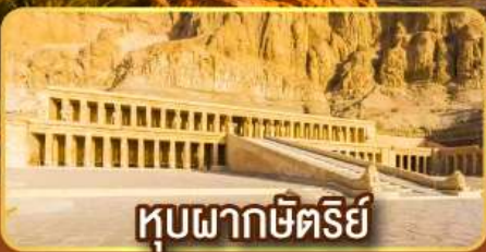
หุบผากษัตริย์