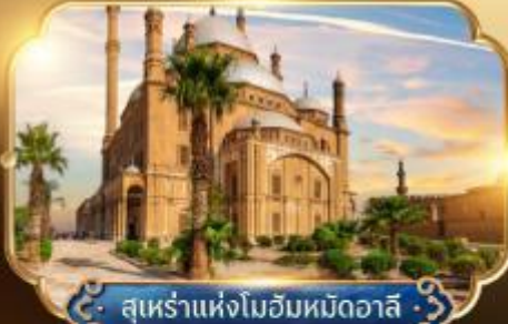
สุเหร่าแห่งโมฮัมหมัดอาลี