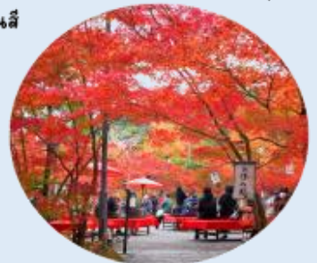
ที่ให้ภาพบรรยากาศที่งดงามของลานหนึ่งสีแดง ที่ปกคลุมไปด้วยใบไม้เปลี่ยนสี