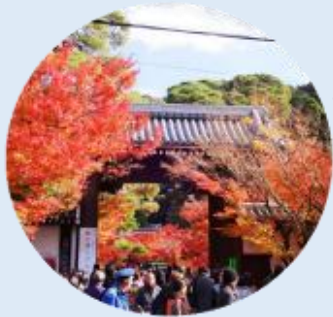
จุดประตูไซมง เป็นประตูทางเข้าหลักของวัดเอคันโด

นำท่านเดินทางสู่ เกียวโต เป็นเมืองที่ได้ชื่อว่าเมืองแห่งศิลปะและวัฒนธรรมของญี่ปุ่นอย่างแท้จริง จากนั้นนำท่านเยี่ยมชม วัดเอคันโด (Eikan-do) วัดสวยที่มีชื่อเรียกขานถึง 3 ชื่อ ไม่ว่าจะเป็น เซนรินจิ, โชจูโรโงะซัง หรือ มุเรียวจูอิน วัดนี้ตั้งอยู่บริเวณปลายสุดทางทิศใต้ของ "ทางเดินนักปราชญ์" ในย่านฮิงาชิยามะ โดดเด่นด้วยอาคารไม้โบราณที่เชื่อมถึงกันด้วยทางเดินมีหลังคาคลุมลัดเลาะไปตามสวน วัดเอคันโด มีประวัติศาสตร์ยาวนานตั้งแต่สมัยเฮอัน โดยเริ่มจากขุนนางระดับสูงได้มอบพื้นที่แห่งนี้ให้เป็นที่พำนักของพระสงฆ์ ภายในวัดเต็มไปด้วยงานศิลปะที่ทรงคุณค่า โดยเฉพาะ รูปปั้นพระอมิตาพุทธ ที่มีเอกลักษณ์ไม่เหมือนใคร เพราะพระเศียรจะหันไปทางด้านข้าง ซึ่งมีตำนานเล่าว่า พระองค์เคยหันมาพูดคุยกับเจ้าอาวาสนั่นเอง นอกจากนี้ ที่นี่ยังเป็น "แลนด์มาร์ค" อันดับหนึ่งสำหรับการชมใบไม้เปลี่ยนสีในช่วงปลายเดือน พฤศจิกายน ซึ่งจะสวยงามเป็นพิเศษทำให้บรรยากาศดูราวกับอยู่ในเทพนิยาย ภายในวัดมีมุมถ่ายรูปเก๋ๆ กับใบไม้แดงเพียง