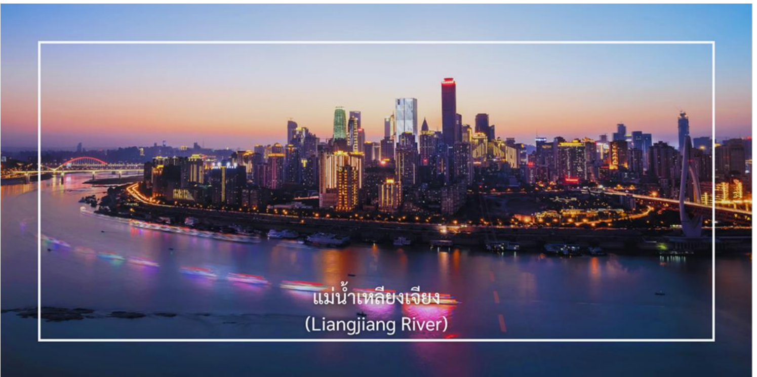
แม่น้ำเหลียงเจียง (Liangjiang River)

ล่องเรือแม่น้ำเหลียงเจียง (Liangjiang Cruise) พื้นที่จุดบรรจบของแม่น้ำทั้งสอง ซึ่งเป็นหนึ่งในมุมมองที่สวยงามที่สุดของเมืองฉงชิ่ง ซึ่งประกอบด้วย แม่น้ำแยงซี (Yangtze River) เป็นแม่น้ำสายที่ยาวที่สุดในจีน และเป็นสายหลัก แม่น้ำเจียงหลิง (Jialing River) แม่น้ำสาขาที่สำคัญซึ่งไหลลงสู่แม่น้ำแยงซี พื้นที่ที่แม่น้ำทั้งสองสายนี้มาบรรจบกันมีชื่อว่า “เหลียงเจียง” กิจกรรมล่องเรือสองแม่น้ำ (Two Rivers Cruise) ซึ่งได้รับความนิยม เพราะจะได้ชมเส้นขอบฟ้าของฉงชิ่งยามค่ำคืน ตึกระฟ้า แสงไฟเมือง เป็นเอกลักษณ์