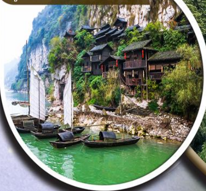
หมู่บ้านโบราณชาวจีนเหอหนาน