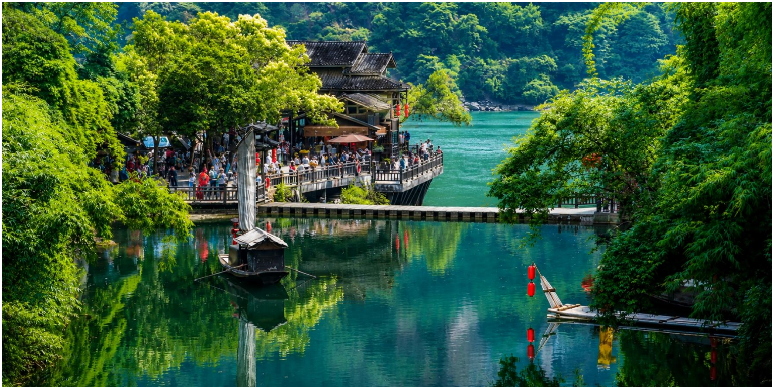
เที่ยง บริการอาหารเที่ยง ณ ภัตตาคาร (มือที่2)

นำท่านสู่ หมู่บ้านซานเซียเหรินเจีย (Sanxia Renjia) (รวมล่องเรือ) สถานที่นี้เป็นที่รู้จักกันในชื่อ หมู่บ้านสามผา แหล่ง ท่องเที่ยวระดับ 5A ตั้งอยู่ในเขตหุบเขาสามผา ริมแม่น้ำแยงซีเกียง โดดเด่นด้วยทัศนียภาพทางธรรมชาติอันงดงามของ ภูเขาหินผา สายน้ำ และหุบเขาที่โอบล้อมกันอย่างกลมกลืน สถานที่แห่งนี้สะท้อนวิถีชีวิตดั้งเดิมของชาวลุ่มแม่น้ำแยงซี เกียง ผ่านสถาปัตยกรรมพื้นบ้าน วัฒนธรรม ประเพณี ที่ยังคงเอกลักษณ์ไว้อย่างครบถ้วน พร้อมให้ท่านได้ชมการแสดง เรื่องราวเกี่ยวกับวิถีชีวิตควบคู่กับสายน้ำ