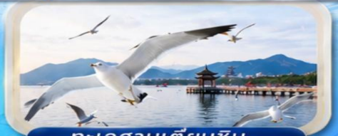
ทะเลสาบเตียนซิน