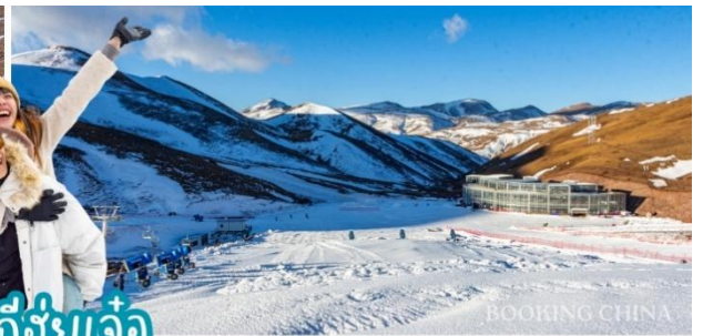
ลานสกีฮู่เจ้อ