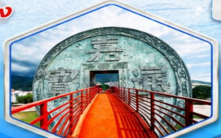
จตุรัสเหรียญโบราณ