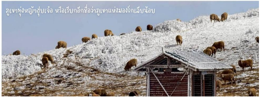
ภูเขาทุ่งหญ้าฮู่เจ้อ หรือเรียกอีกชื่อว่าภูเขาแห่งมองโกเลียน้อย

นำท่านเดินทางสู่ลานสกีฮู่เจ้อ ให้ท่านได้เพลิดเพลินกับหิมะขาวโพน และสนุกกับการเล่นสกี ลานสกีฮู่เจ้อ หรือที่มีชื่อทางการว่า Dahaicaoshan International Ski Resort (ลานสกีดาหายเฉ่าฉาน) ตั้งอยู่ในเมืองฮู่เจ้อ (Huize) มณฑลยูนนาน ประเทศจีน โดยเป็นลานสกีบนพื้นที่ทุ่งหญ้าบนภูเขาสูงระดับ 3,500 เมตรจากระดับน้ำทะเล ที่ได้รับความนิยมอย่างมากในหมู่นักท่องเที่ยวชาวไทย นอกจากสกีแล้ว ยังมีจุดชมวิวสำหรับผู้ที่ไม่ได้เล่นสกี สามารถพักผ่อน ถ่ายรูป หรือเดินชมทิวทัศน์ได้