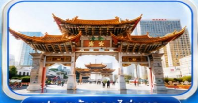
ประตูม้าทองโก๋หยก