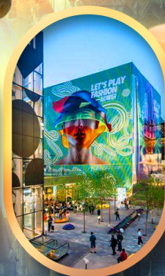
ย่านชานหลี่กุน