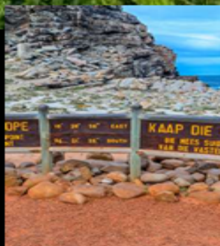
Cape good hope