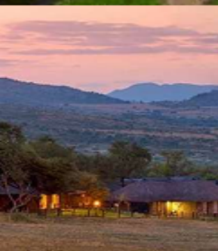
พัก SAFARI LODGE