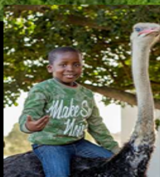
พำรมนทระจกาทศ