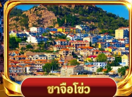
ซาจิวโซ่ว