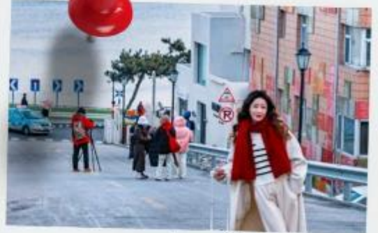
ถนนฮั่วจวีปา