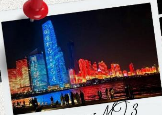
หาดไซเบอร์ MO.3