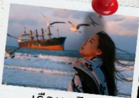
เรือบลูวิส