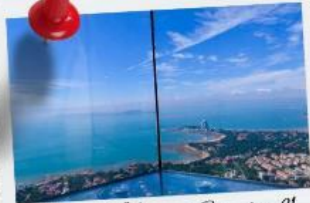
Qingdao Heitian Center ชั้น 81