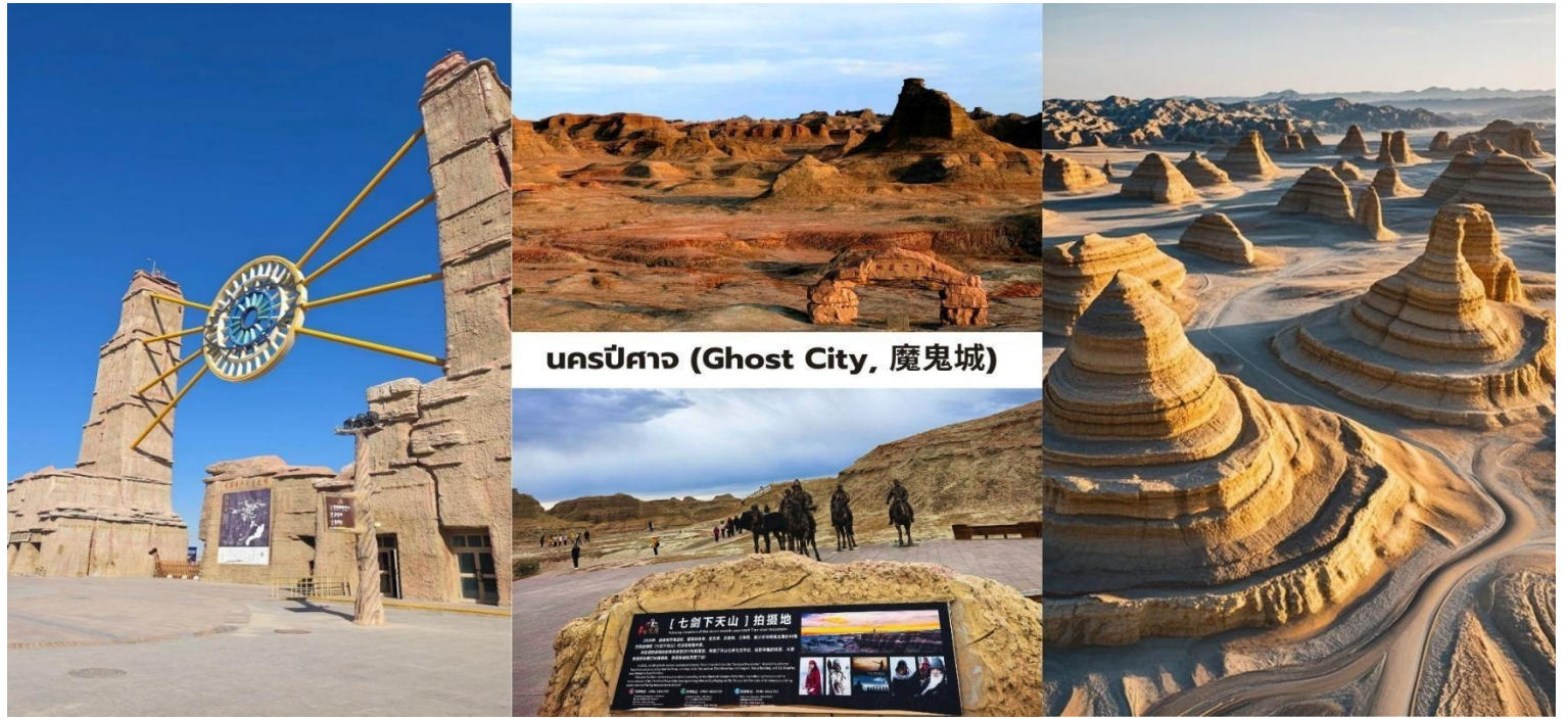
นครปีศาจ (Ghost City, 魔鬼城)