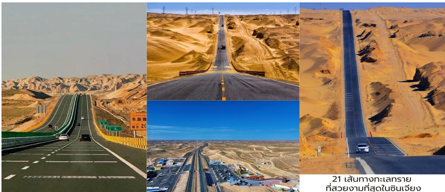
S21 เส้นทางทะเลทรายที่สวยงามที่สุดในซินเจียง

นำท่านเดินทางสู่ เมืองบูร์จิน (Burqin, 布尔津) ผ่านทางหลวงหมายเลข S21 เส้นทางทะเลทรายที่สวยงามที่สุดในซินเจียง ถือเป็นหนึ่งเส้นทางที่งดงามและน่าทึ่งที่สุดของเขตปกครองตนเองซินเจียง เส้นทางนี้ทอดยาวกว่า 520 กิโลเมตร ใช้เวลาเดินทางโดยรถยนต์ประมาณ 6 ชั่วโมงครึ่ง ผ่านภูมิประเทศอันหลากหลายจากภูเขาสูง หุบเขา ไปจนถึงทะเลทรายอันเว้งว่าง ถนน S21 ตัดผ่านภูมิประเทศทะเลทรายกว้างใหญ่ตระการตา สีกองของผืนทรายตัดกับฟ้าสีครามราวภาพวาด บางช่วงสามารถมองเห็นเนินทรายที่ทอดยาวสุดลูกหูลูกตาเป็นจุดถ่ายภาพยอดนิยมสำหรับนักเดินทางสาย Road Trip