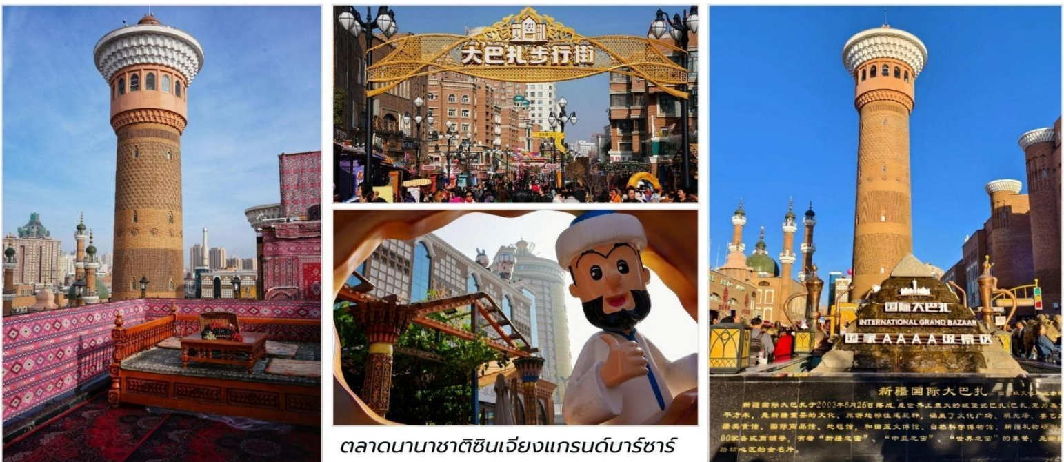
ตลาดนานาชาติซินเจียงแกรนด์บาร์ซาร์