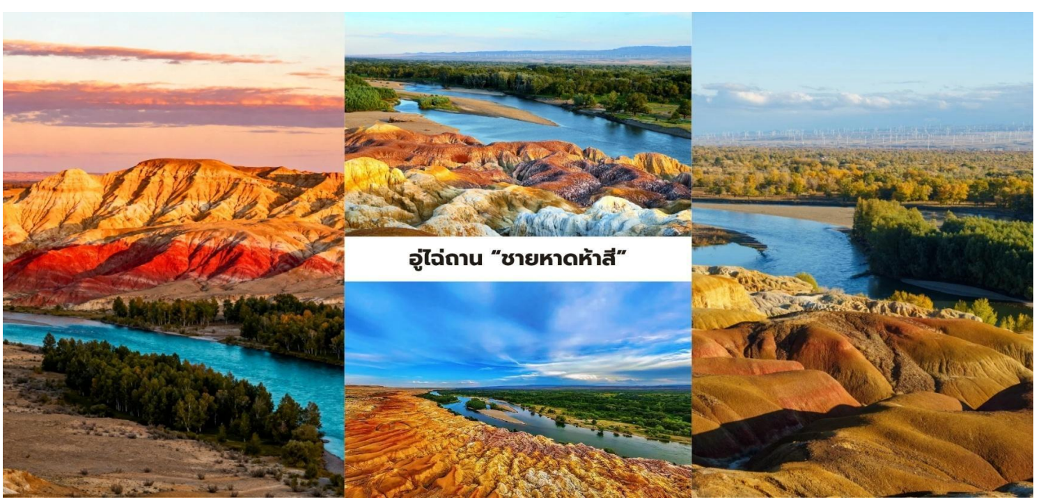
อุทยาน "ชายหาดห้าสี"

คำ บริการอาหารคำ ณ ภัตตาคาร ที่พัก Shang Shi International Hotel ระดับ 4* หรือเทียบเท่า