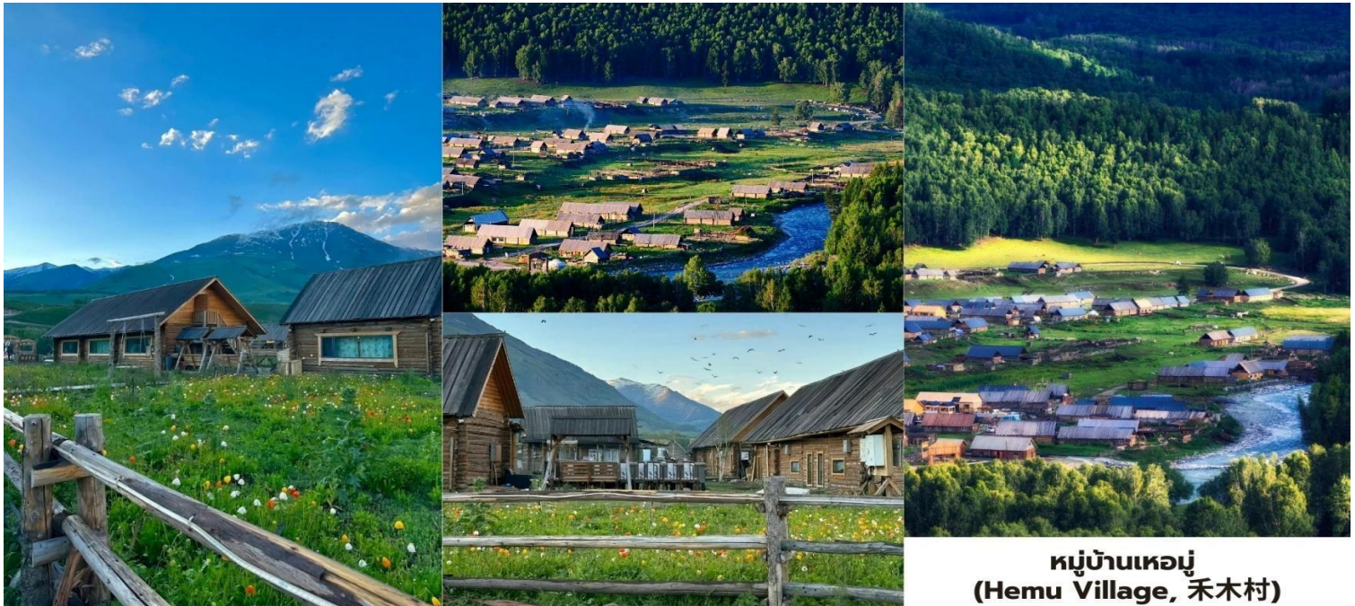
หมู่บ้านเหมอู่ (Hemu Village, 禾木村)

บ่าย นำท่านเดินทางสู่ เมืองบูร์จิน (Burqin, 布尔津) ใช้เวลาเดินทางประมาณ 3 ชั่วโมง 30 นาที บูร์จินคือ ทัศนียภาพที่งดงามที่ซ่อนตัวอยู่ทางตอนเหนือของเขตปกครองตนเองซินเจียงอุยกูร์และเป็นจุดเชื่อมต่อสำคัญสู่แหล่ง