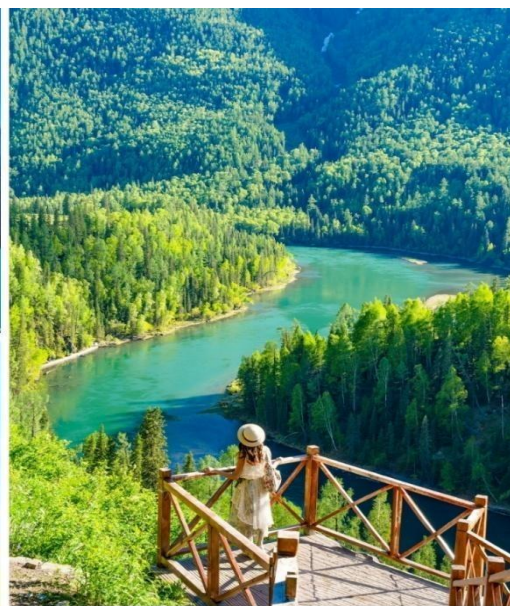
อุทยานแห่งชาติคานาส

คำ บริการอาหารค่ำ ณ ภัตตาคาร ที่พัก Hongbai Hualin Hotel ระดับ 4* หรือเทียบเท่า